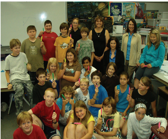
Visite du personnel de l'Ombudsman aux élèves de 6e année, à l'école élémentaire de Carman, en juin 2010

Rencontrez le personnel du bureau de l'Ombudsman et obtenez du matériel éducatif et promotionnel, cet automne à nos kiosques, aux endroits suivants :