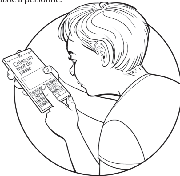
Illustration de la tablette

Après avoir inscrit ton mot de passe sur cette feuille, demande à un adulte si ce mot de passe est sécuritaire. Tu sauras ainsi comment créer un mot de passe sécuritaire par toi-même.